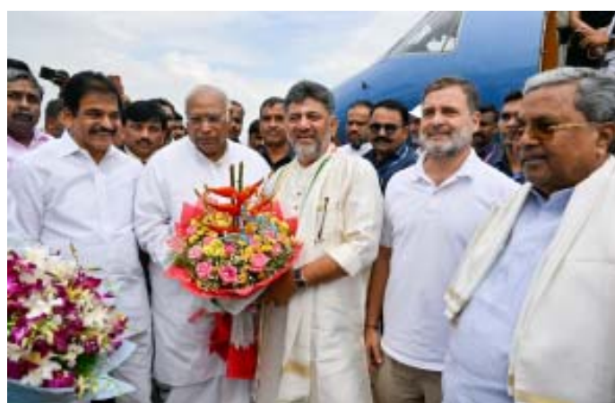
బెంగళూరు, జూన్ 3: కర్ణాటక ముఖ్యమంత్రిగా కాంగ్రెస్ సీనియర్ నేత డి.కె. శివకుమార్ ప్రమాణస్వీకారం చేశారు. లోక్ సభలో బుధవారం సాయంత్రం 4.05 గంటలకు ప్రమాణ స్వీకార కార్యక్రమం జరిగింది. డి.కె. శివకుమార్ తో గవర్నర్ తావరచంద్ గెవ్లకే ప్రమాణస్వీకారం

ఉపముఖ్యమంత్రిగా జి. పరమేశ్వర్ మొత్తం 13 మంది మంత్రుల ప్రమాణం నిర్దరామయ్య, ఖర్గేల తనయలకు కెబిసీలో హోటు కార్డుకవాలికి హాజరైన రావలల్, ఖర్గే, వెణుగోపాల్, రేవంత్ రెడ్డి