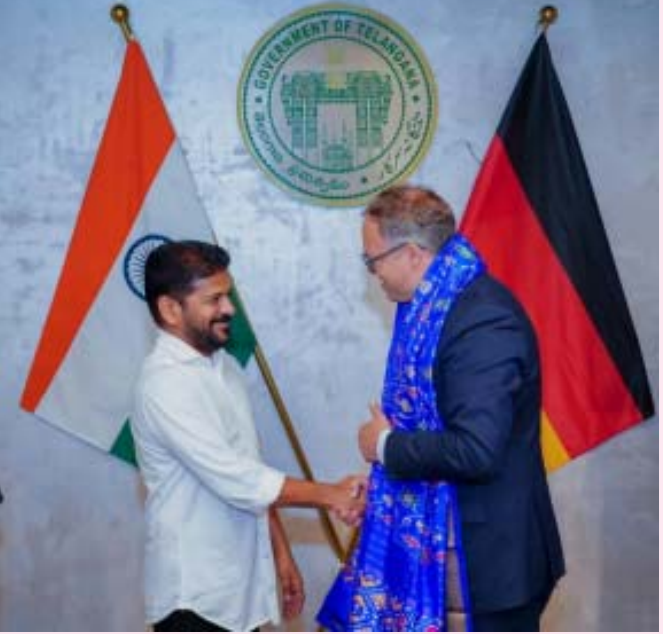
హైదరాబాద్, జూన్ 3: తెలంగాణ, జర్మనీలోని తూర్ంగియా రాష్ట్రాల మధ్య కీలక ఒప్పందం కుదిరింది. బెక్కాల్, నైపుణ్యాభివృద్ధి, స్టాడంట్లు, లైఫ్ సైన్సెస్ రంగాల్లో పరస్పర సహకారం కోసం తెలంగాణ ప్రభుత్వం, తూర్ంగియా రాష్ట్ర ప్రభుత్వం మధ్య అవగాహన ఒప్పందం కుదిరింది. జర్మనీ తుర్ంగియా రాష్ట్ర సీఎం మారియో వోయిట్ నేతృత్వంలోని ఉన్నతస్థాయి ప్రతినిధి బృందం హైదరాబాద్ లో సీఎం. రేవంత్ రెడ్డితో